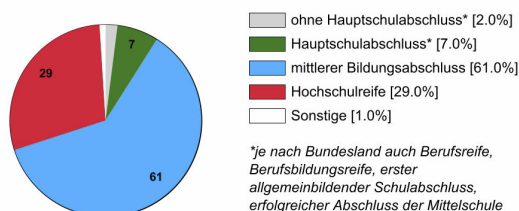
Ausbildungsbereich Industrie und Handel